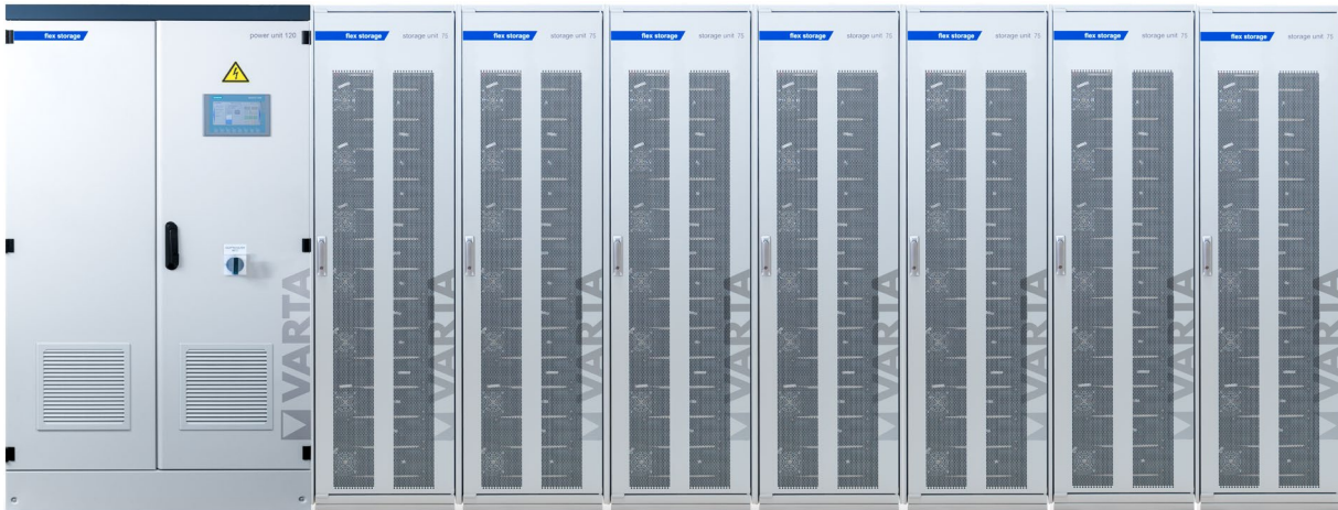
Abbildung 1: E 120/525 (170A ES) –beispielhafte Darstellung (Abbildung ähnlich)