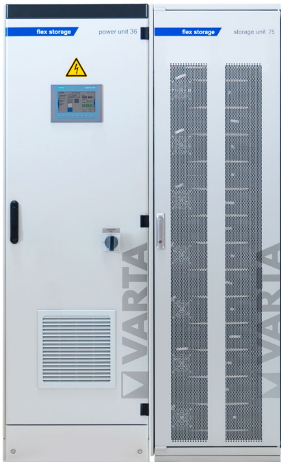
Abbildung 1: E 36/75 – beispielhafte Darstellung (Abbildung ähnlich)