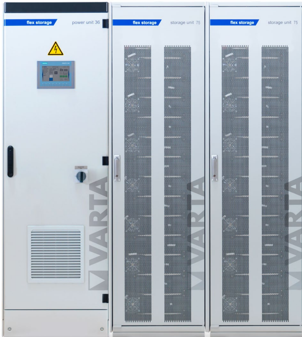
Abbildung 1: E 36/150 (50A ES) –beispielhafte Darstellung (Abbildung ähnlich)