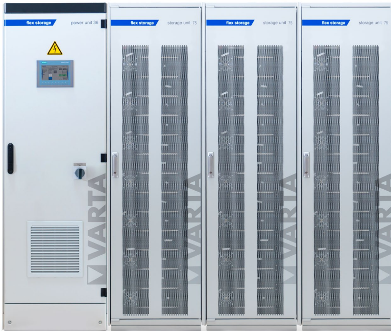
Abbildung 1: E 36/225 – beispielhafte Darstellung (Abbildung ähnlich)