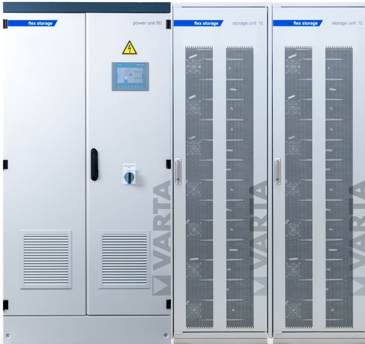
Abbildung 1: E 80/150 – beispielhafte Darstellung (Abbildung ähnlich)