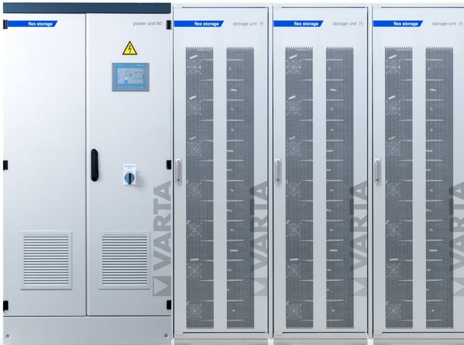
Abbildung 1: E 80/225 – beispielhafte Darstellung (Abbildung ähnlich)