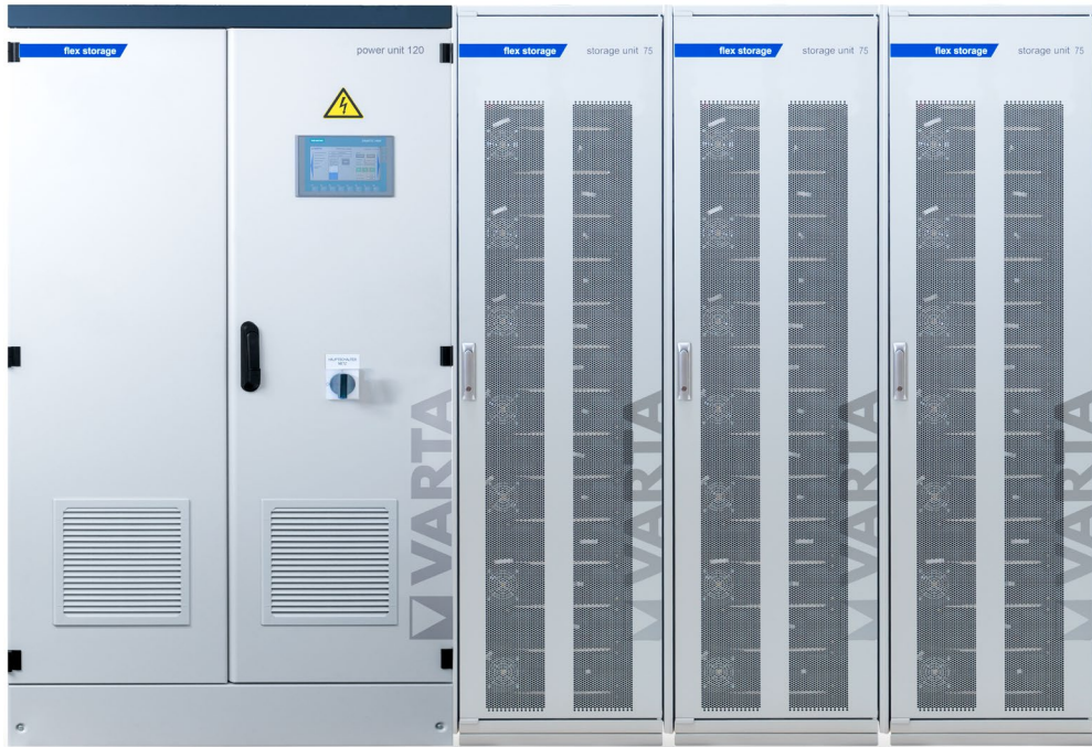
Abbildung 1: E 120/225 – beispielhafte Darstellung (Abbildung ähnlich)