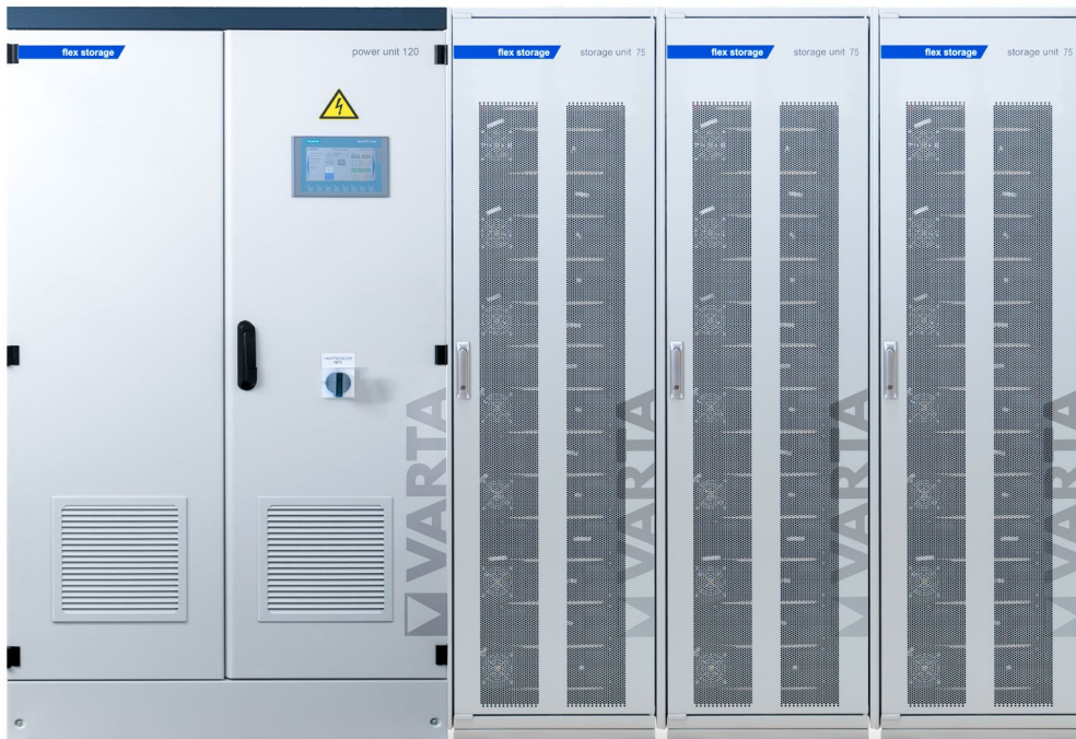
Abbildung 1: E 120/225 (170A ES) –beispielhafte Darstellung (Abbildung ähnlich)