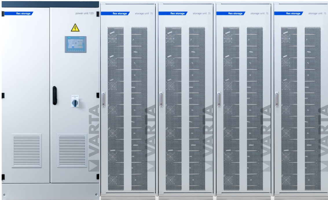
Abbildung 1: E 120/300 – beispielhafte Darstellung (Abbildung ähnlich)