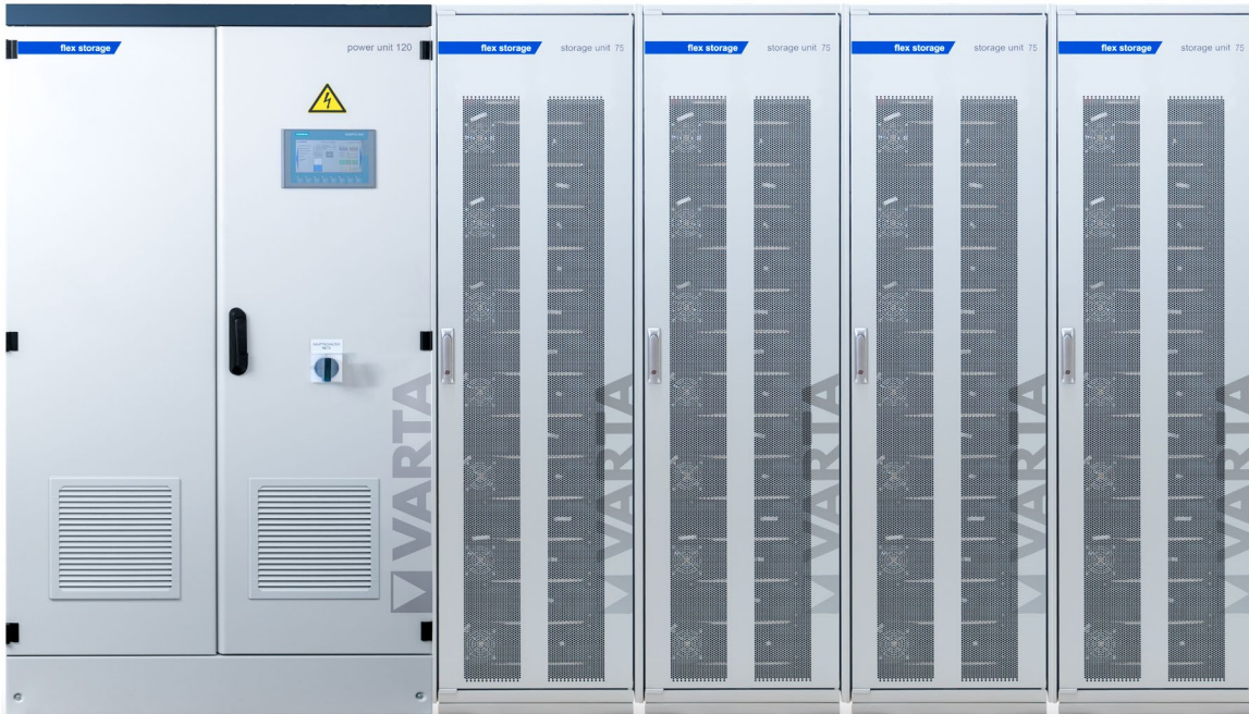
Abbildung 1: E 120/300 (170A ES) –beispielhafte Darstellung (Abbildung ähnlich)