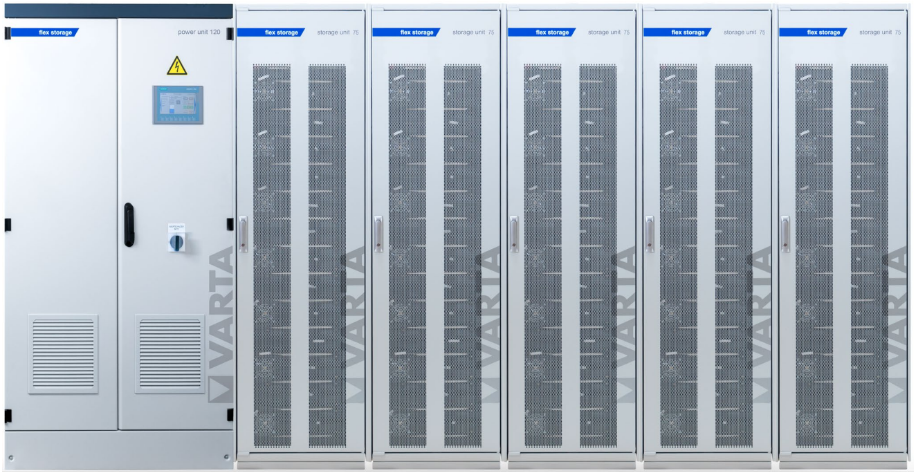
Abbildung 1: E 120/375 – beispielhafte Darstellung (Abbildung ähnlich)