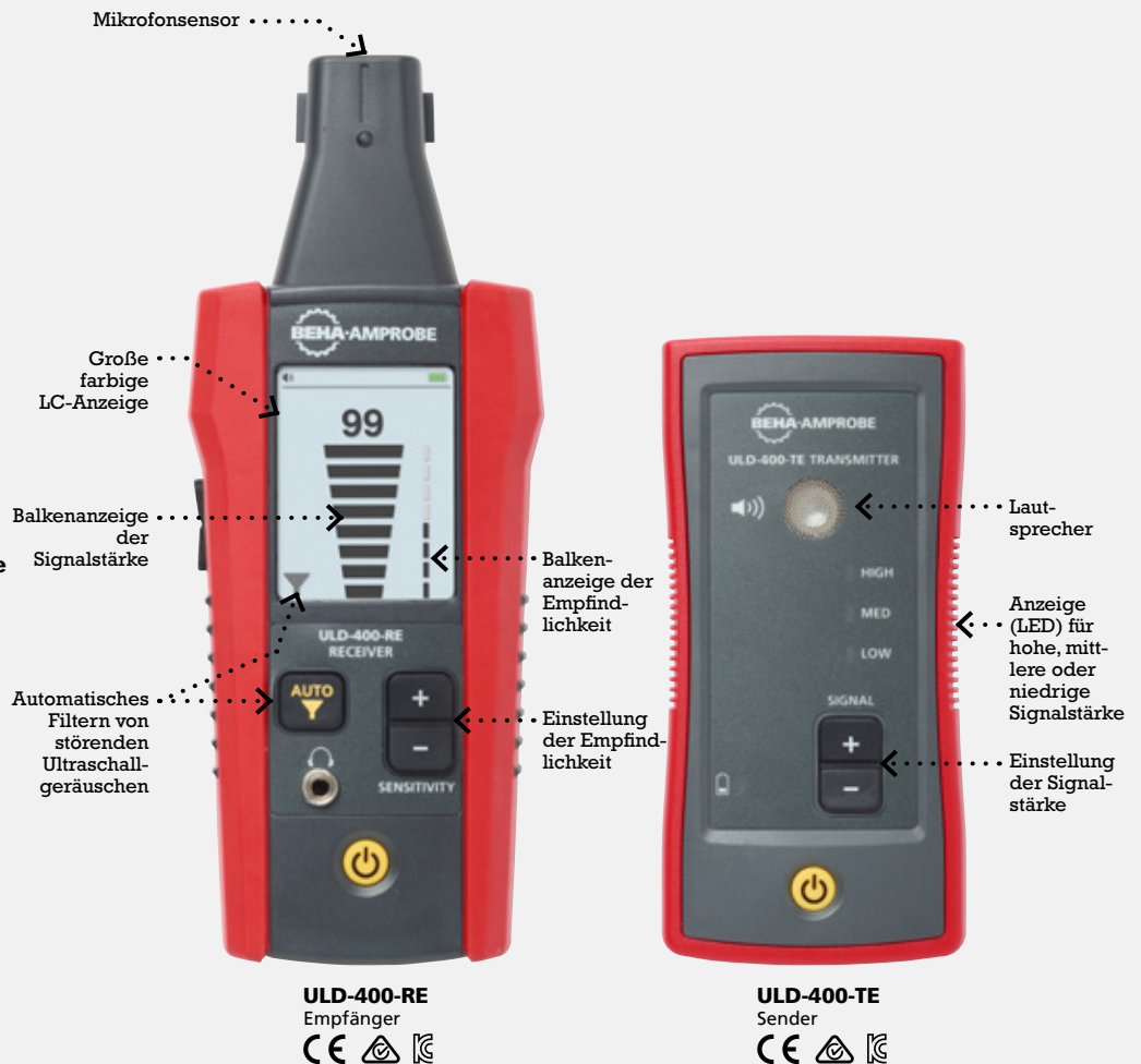
ULD-400-RE Empfänger CE

* Verwenden Sie den Leckdetektor ULD-400-EUR nicht für die Suche von Lecks von brennbaren Gasen.