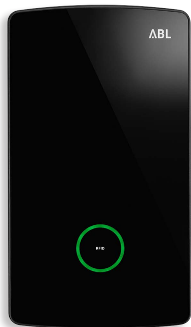
Référence du produit 100000157

Sa conception robuste et sa finition de qualité protègent la Wallbox eM4 Single des agressions extérieures. Grâce à son équipement standard avec un interrupteur différentiel de type A et contrôleur d'isolement à courant différentiel résiduel, la Wallbox est prête à brancher. Toutes les Wallbox d'ABL sont « Made in Germany » et offrent le plus haut niveau de sécurité.