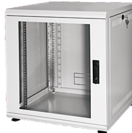
600er mit Nivellierfüßen