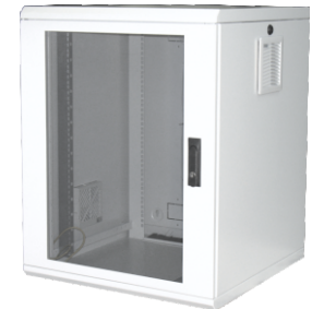
Ausführung - Lüftermontage vorbereitet