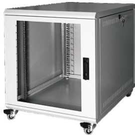
800er mit Doppellenkrollen