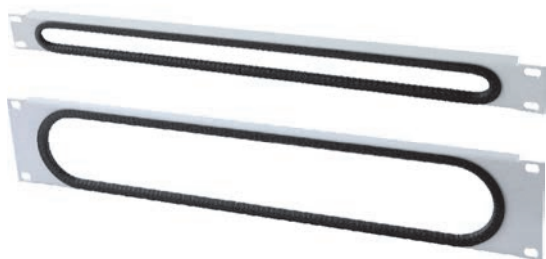
Größe 2 HE Einführöffnung 65 x 405