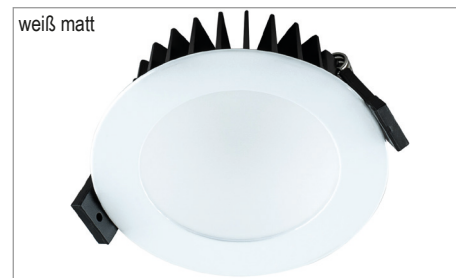
L54N150125 15W Leuchte mit Netzgerät