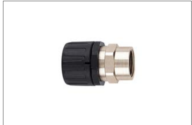
HeliaGuard HG-SF gerade Verschraubung mit drehendem Messing-Innengewinde.