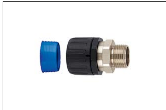
HelaGuard HGL-SM gerade Verschraubung mit drehendem Außengewinde inkl. Schlauchdichtung.