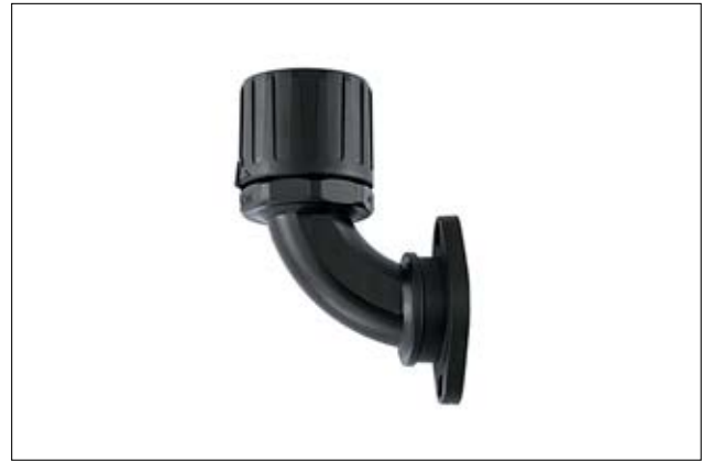
HelaGuard HG-90FL 90° drehende Flanschverschraubung.