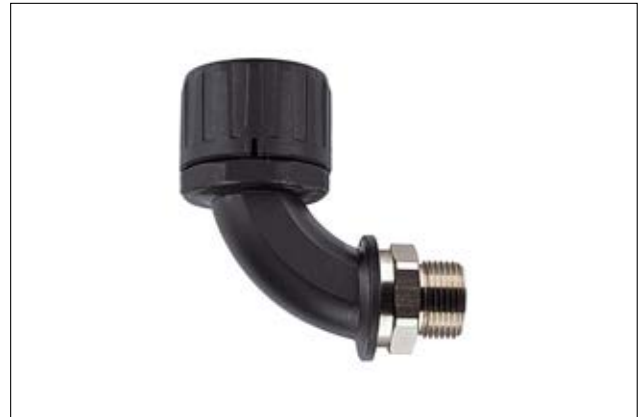
HelaGuard HG-90M 90°-Verschraubung mit drehendem Messing-Außengewinde.