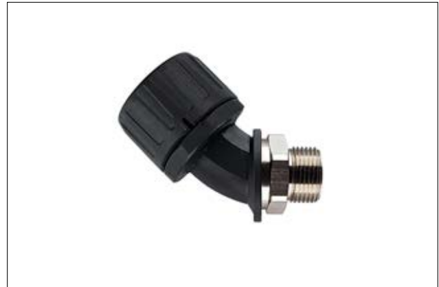
HelaGuard HG-45M 45°-Verschraubung mit drehendem Messing-Außengewinde.