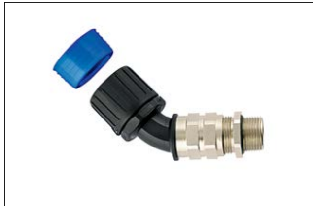
HelaGuard HGL-45CG 45°-Verschraubung mit Zugentlastung und Kabelabdichtung, Außengewinde.