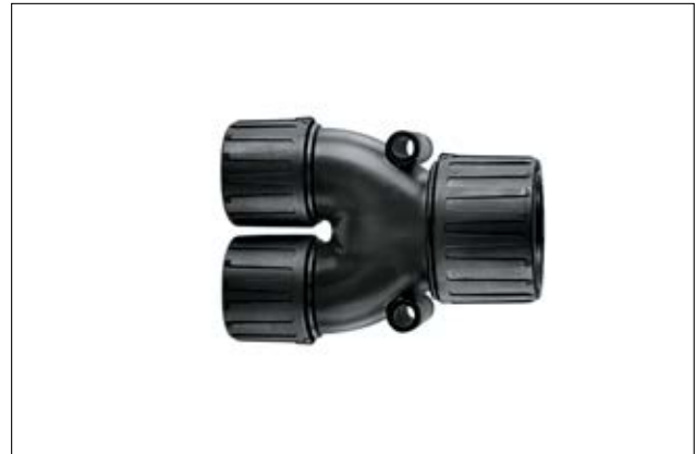
HelaGuard HG-Y Y-Verteiler, IP66.