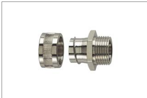
HelaGuard SC-FM mit starrem Außengewinde.