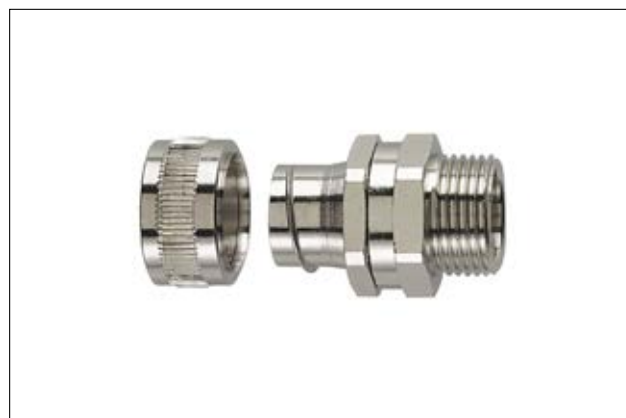
HeliaGuard SC-SM mit drehendem Außengewinde.