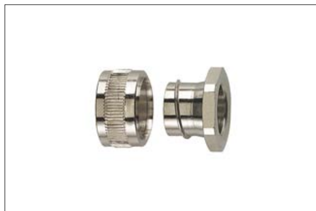
HeliaGuard SC-PC Einführungsbuchse.