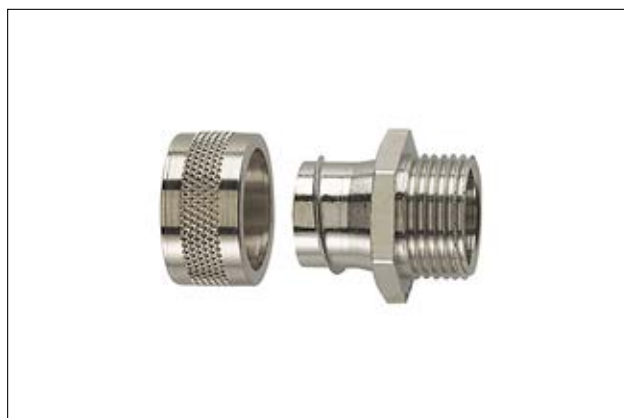
HelaGuard PCS-FM mit starrem Außengewinde.