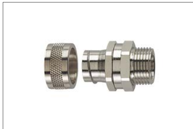
HeliaGuard PCS-SM mit drehendem Außengewinde.