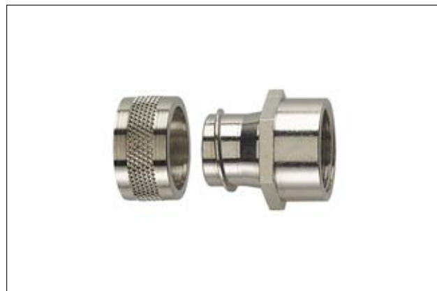
HelaGuard PCS-FF mit starrem Innengewinde.