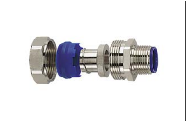
HelaGuard LTS-FMC Kompressionsverschraubung.