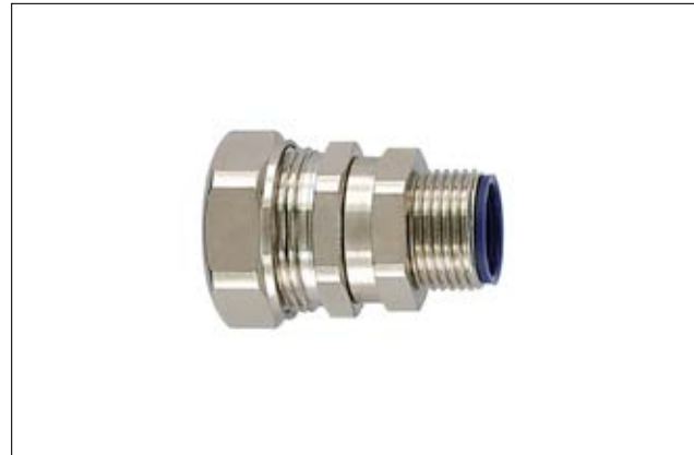
HelaGuard LTS-SMC drehende Kompressionsverschraubung.