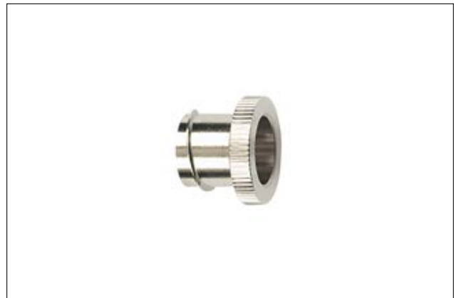
HeliaGuard LTS-EI Endverschluss.