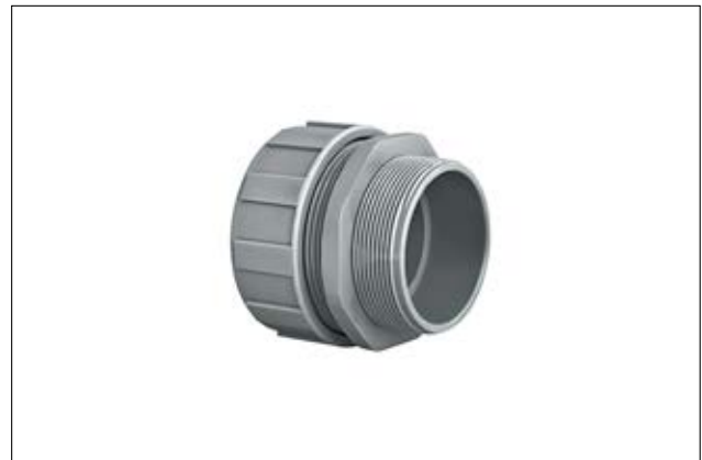
PSR-S gerade Verschraubung.