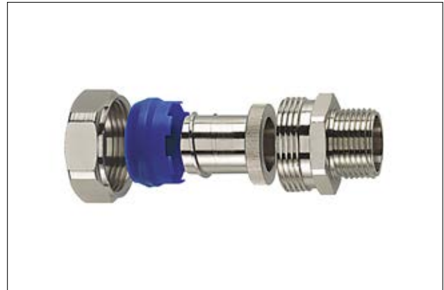
HelaGuard PSRSC-FMC gerade Kompressionsverschraubung.