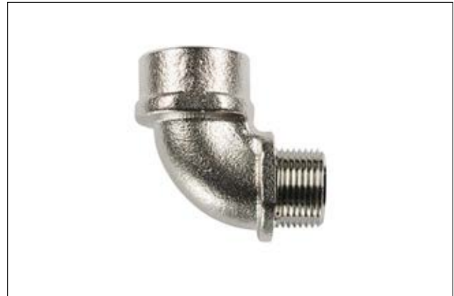
HelaGuard A90FM 90°-Verschraubung.