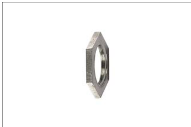
HelaGuard ALNPB Gegenmutter, Messing vernickelt.

Die sechskantige ALNPB Gegenmutter dient als zusätzliche Sicherung der Verschraubung.