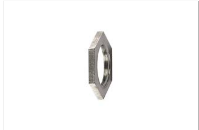
HelaGuard ALS Gegenmutter, verzinkter Stahl.

Die sechskantige ALS Gegenmutter dient als zusätzliche Sicherung der Verschraubung.