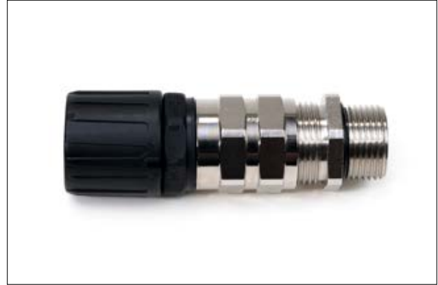
HG-SCG gerade Verschraubung mit Zugentlastung und Kabelabdichtung, Außengewinde.