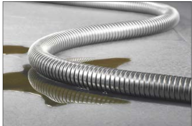
HelaGuard SSC Edelstahlschutzschlauch aus korrosionsbeständigem Edelstahl.