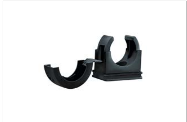
HelaGuard AFCP Befestigungsschelle.

www.HellermannTyton.de/CAD-download-AFCP-Clips