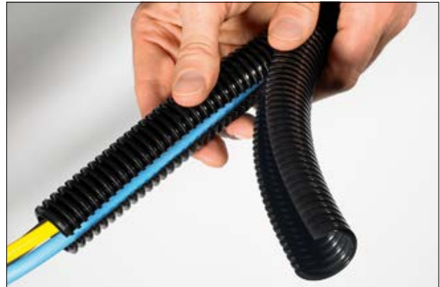
HelaGuard HG-DC PA6 doppelt geschlitzter Schutzschlauch.