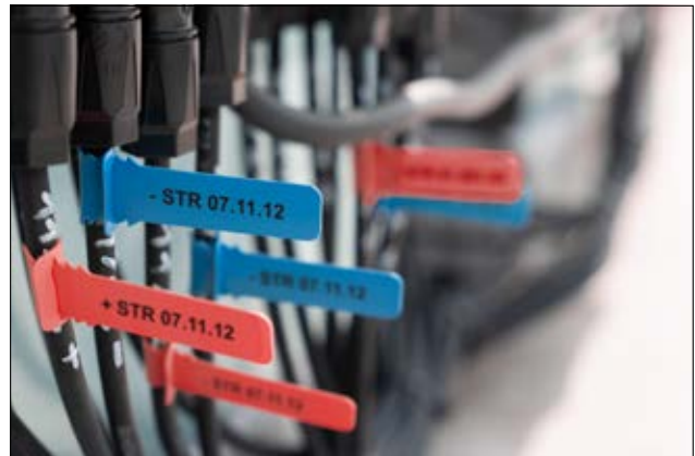
TAGPU LOOP – Ideale Lösung für die Kennzeichnung am Wechselrichter.