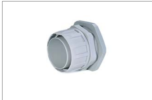
FG-M Verschraubung mit metrischem Gewinde.