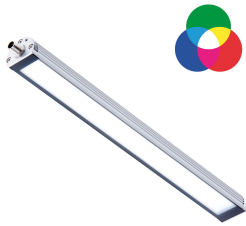
Darstellbares Farbspektrum / Displayable colour spectrum