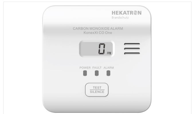
Abb. 1: KonexXt CO One

30 Tage vor Ende der Lebensdauer warnt der Melder mit einem akustischen und optischen Signal.