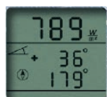
Solare Einstrahlung, Neigungswinkel und Kompasspeilung