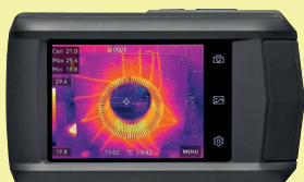
Wärmebildkamera BENNING TC 30

können in Abhängigkeit zur aktuellen Sonneneinstrahlung und Temperatur dokumentiert werden.