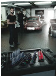
Die Wera Belts