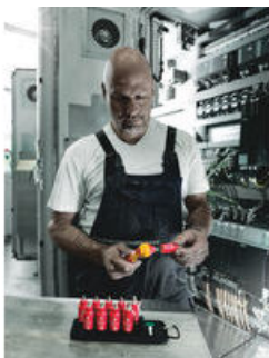
Die Wera Belts