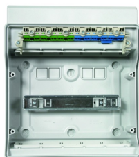
Integrierte Steckklemmtechnik für PE und N.