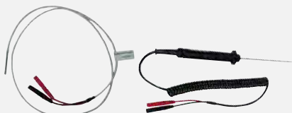
TF220 / TF550